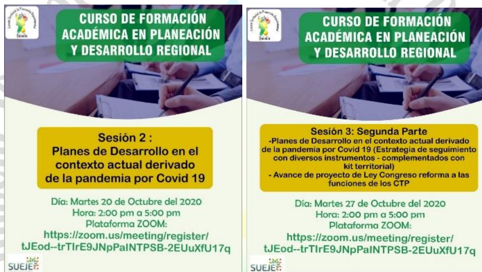
Pieza Publicitaria del Curso de Formación Académica